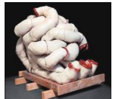
RØRSKULPTUR: Laget av Torbjørn Kvasbø.